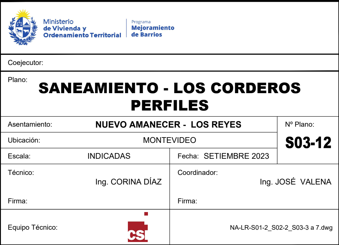
LC-C01 - Los Corderos Colector 01